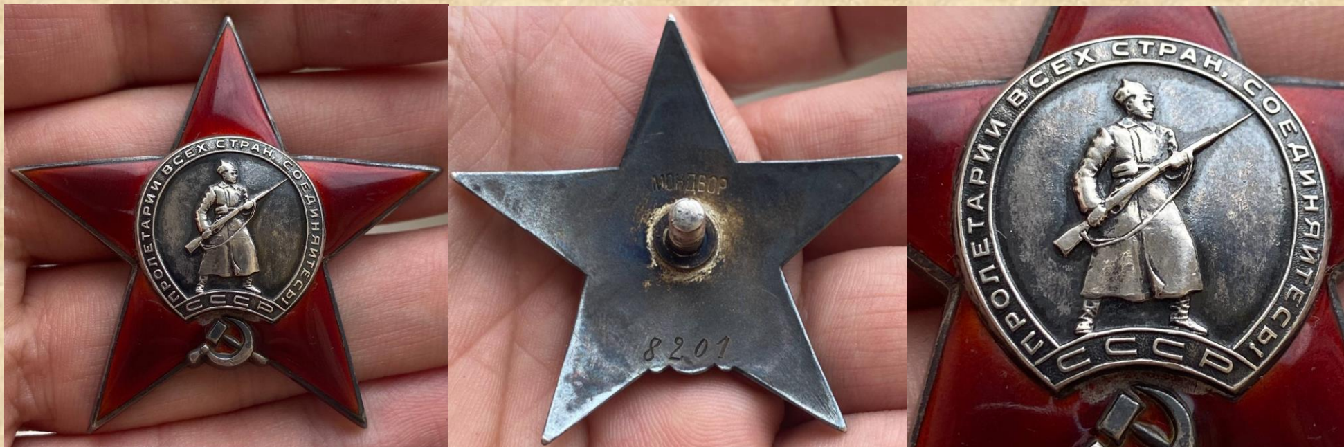
Rodzaj 3. Sygnatura „МОЛДВОР” jest średniej wielkości (8 mm x 1,5 mm). Minimalny znany numer odznaczenia - 7076, maksymalny - 8934.